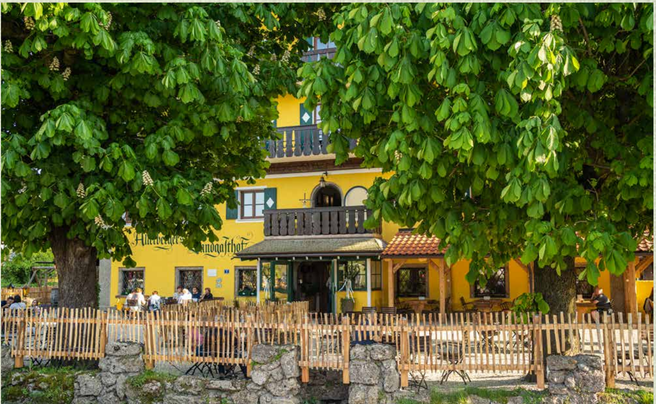
Ein Haus mit Geschichte

Ob unter freiem Himmel, an einem der schattigen Platzerln unter Bäumen und Lauben oder in einer gemütlichen Stuben, im Braugasthof Allerberger finden alle Gäste einen Ort zum rundum Wohlfühlen. Auch die kleinen Gäste am großen Spielplatz.